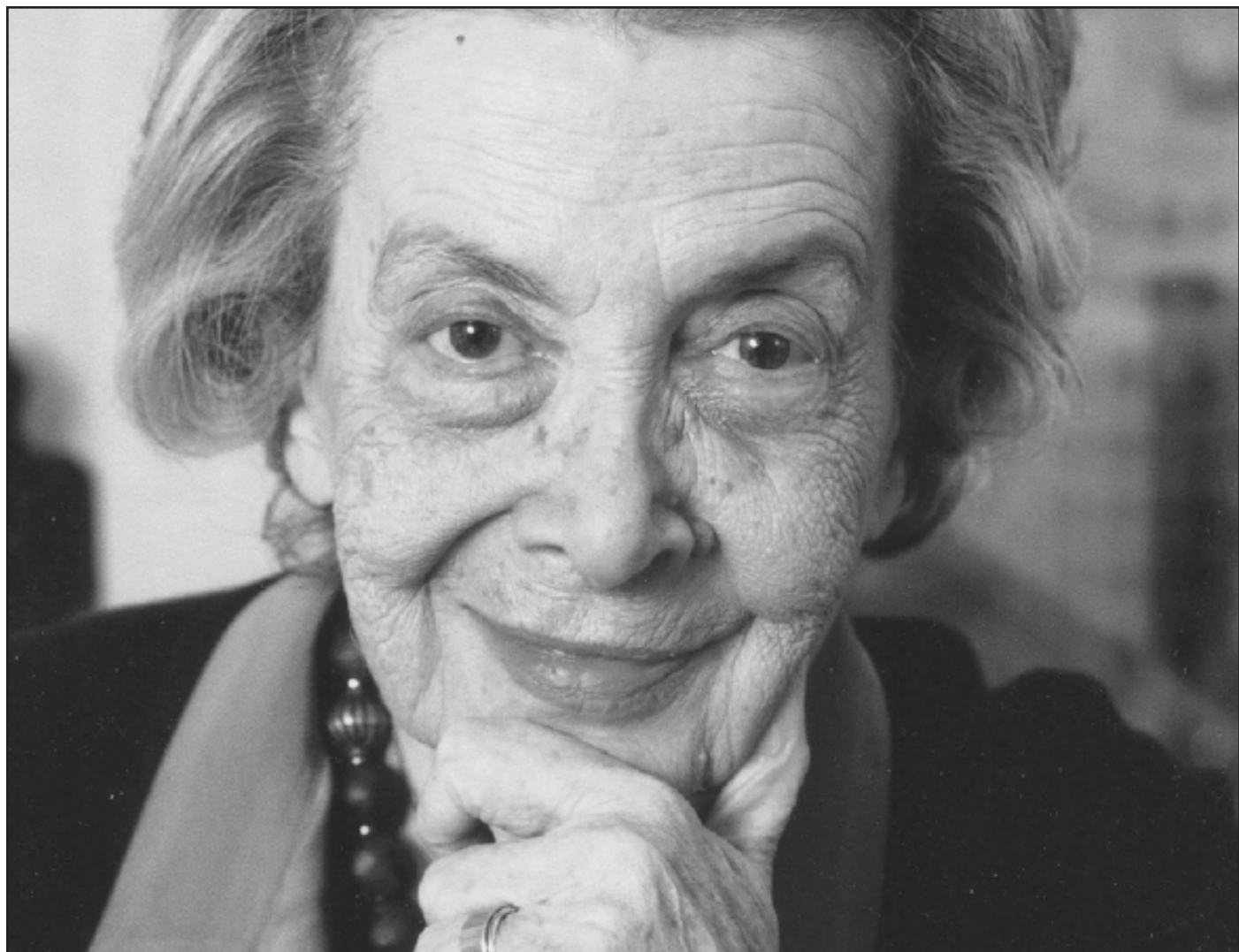
ANDRÉE CHÉDID (El Cairo, Egipto. 1920 – París, Francia. 2011)