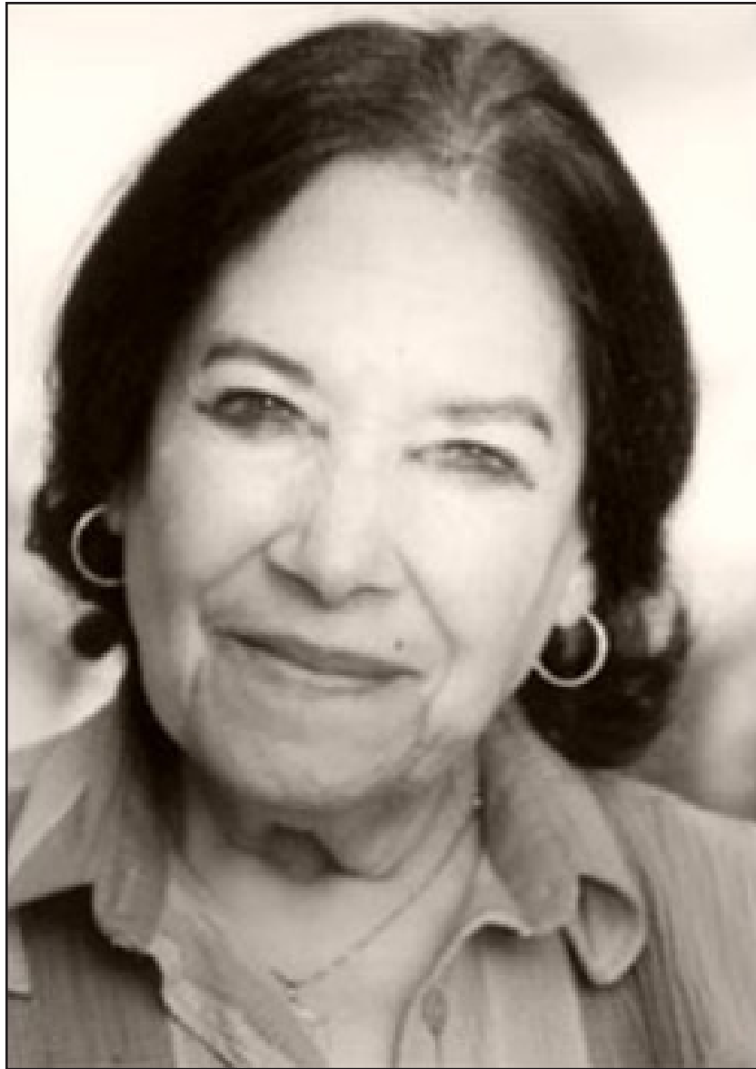
FADWA TUQAN (Nablus, Palestina. 1917– Nablus, Palestina. 2003)