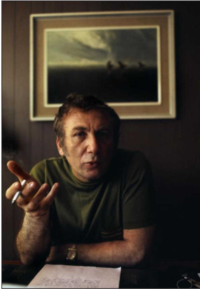
NIZAR QABBANI (Damasco, Siria. 1923 – Londres, Reino Unido. 1998)