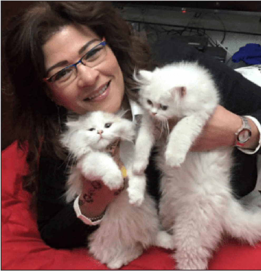
FATIMA NAOOT (El Cairo, Egipto. 1964)