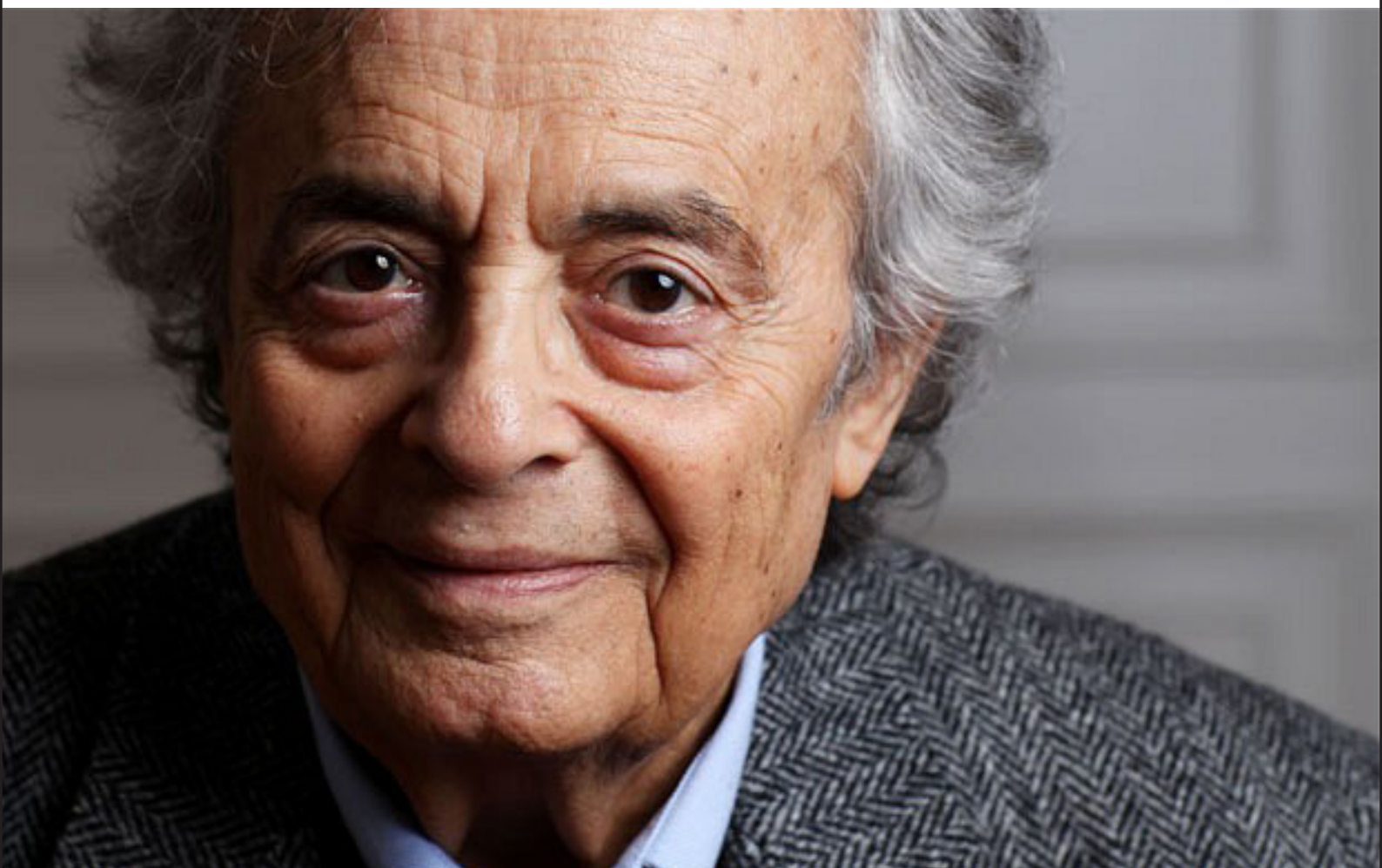
ADONIS (Al-Qassabin, Siria. 1930)