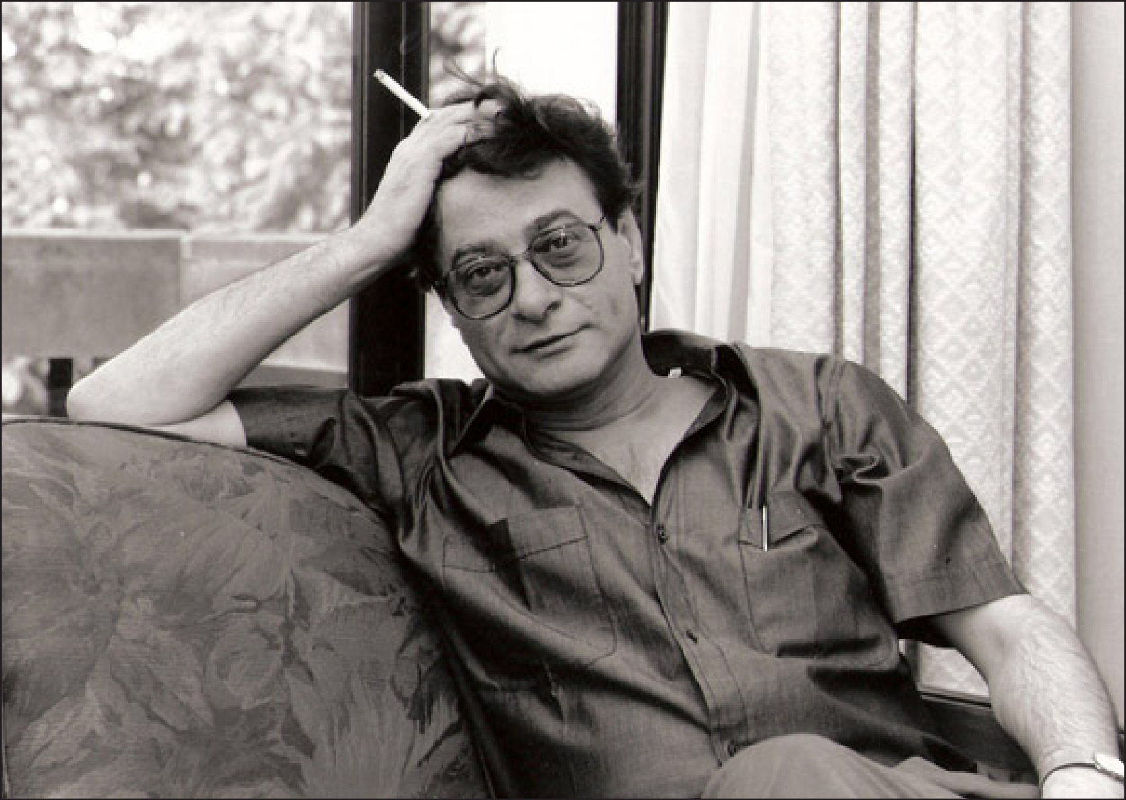
MAHMOUD DARWISH (Al-Birwa, Palestina. 1941– Houston, Texas. 2008)