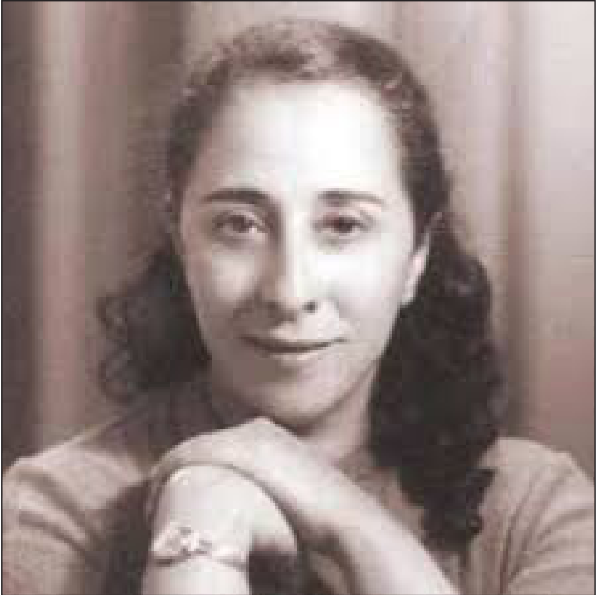
NAZIK AL MALAIKA (Bagdad, Irak. 1922 – El Cairo, Egipto. 2007)