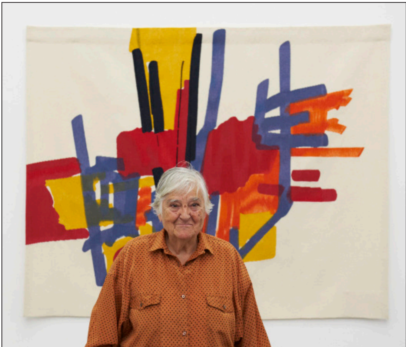
ETEL ADNAN (Beirut, Líbano. 1925)