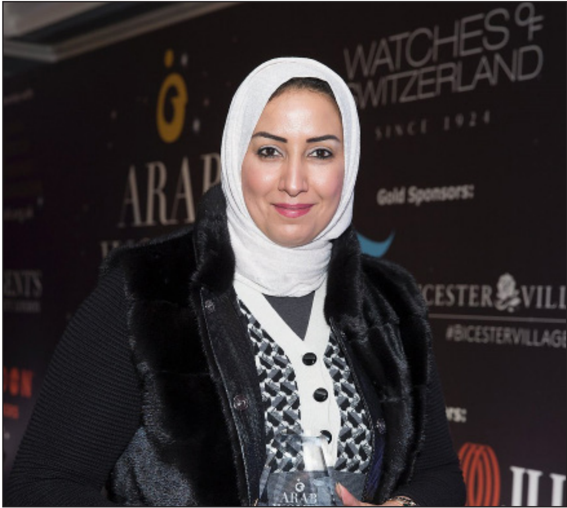
SOUAD AL SABAH (Kuwait, 1942)